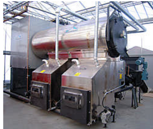
SWEBO BioTherm installationer i Norge.